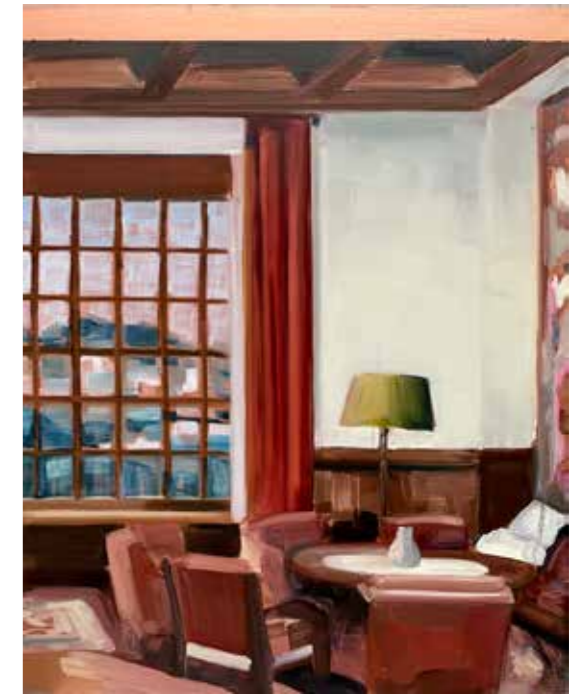
TIM TRANTENROTH Dt. Räume A.H., Reichskanzlei/Obersalzberg 2024 Öl auf MDF, Triptychon, rechtes Bild 50 x 40 cm

1990 * in Zrenjanin / Serbien 2009-13 Akademie der Künste Novi Sad / Serbien 2015-17 Hochschule für Bildende Künste Dresden, Diplomstudium 2017-20 Hochschule für Bildende Künste Dresden, Meisterschülerstudium seit 2017 zahlreiche Ausstellungen, Preise, Stipendien, Publikationen und Projekte im In- und Ausland u. a. 2021 INITIAL Sonderstipendium der Akademie der Künste Berlin lebt und arbeitet in Berlin